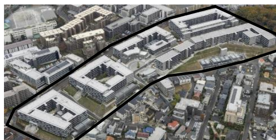
「プロミライズ青葉台」(2025年11月撮影)