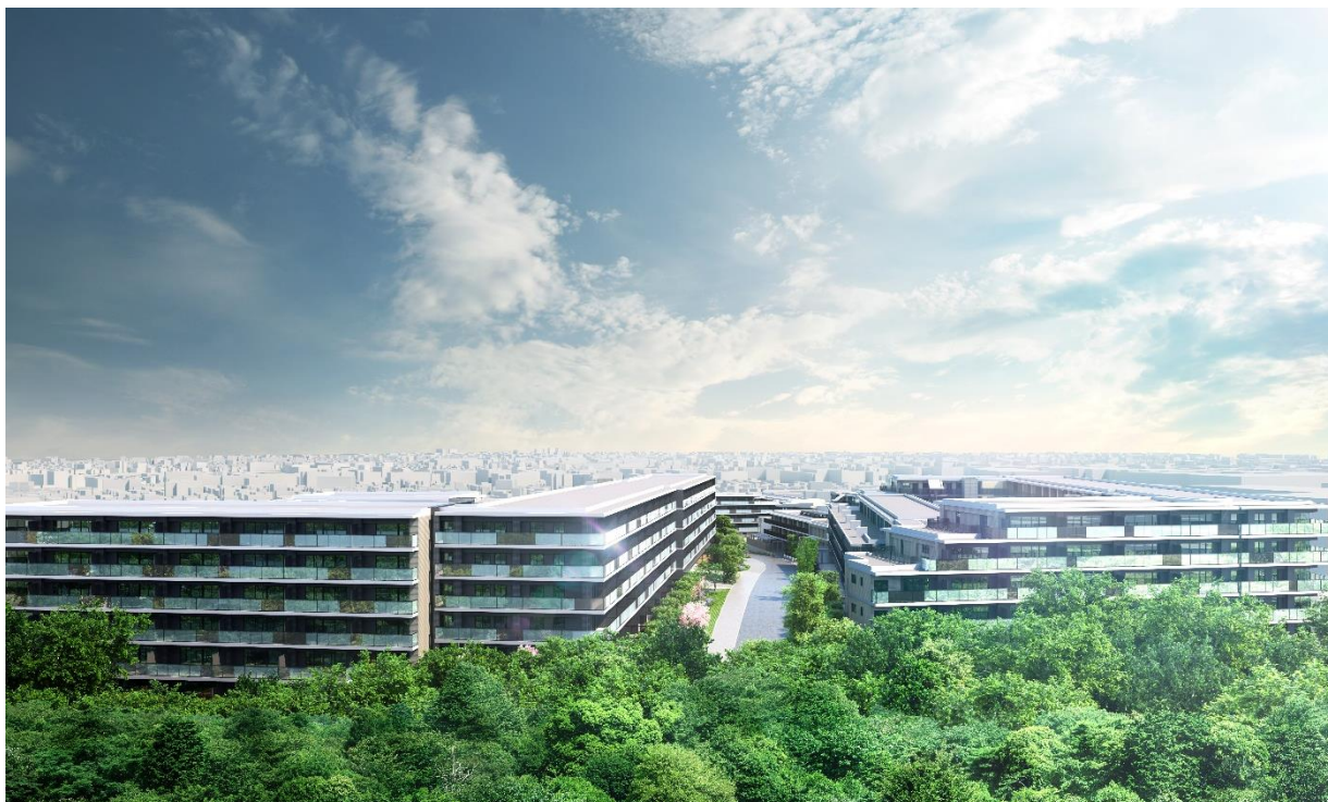
桜台公園越し外観完成予想 CG

販売オフィシャルサイト URL： https://promirise.com/aobadai/