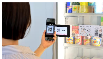
2次元バーコードを読み取ってスタンド開錠