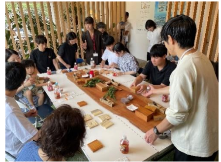
第1回（6月30日開催）・第2回（7月28日開催）ワークショップの様子