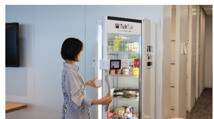
あとは商品を受け取るだけ！