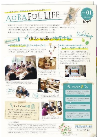
第1回（6月30日開催）実施レポート