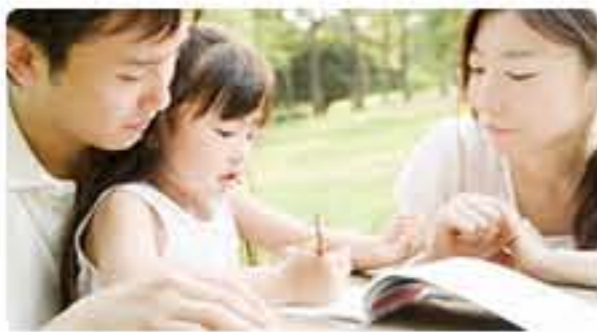
minna no niwa — みんなの庭 —

みんなの庭には、ゆっくり腰掛けてくつろげるように、大きな円形のテーブルとベンチをご用意しています。緑の潤いや吹抜ける風、暖かな陽射しを感じながら住人同士のコミュニケーションを楽しめる憩いの空間です。