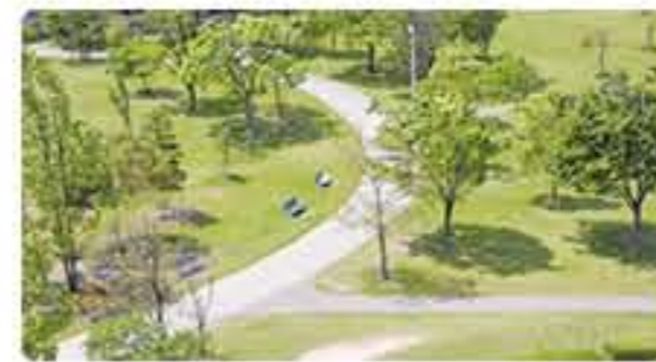
landform — 地形の重視 —

この場所にもともとあった起伏ある地形をいかしながら、擁壁を排した自然な丘のある街並をつくります。住宅とみんなの庭、住宅と住宅をゆるやかにつないで物理的にも精神的にも一体感のあるランドスケープを描きます。